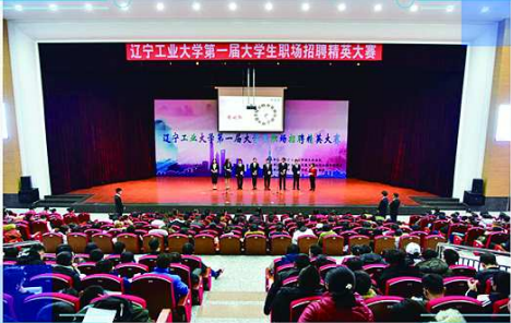
“维森杯”辽宁工业大学第一届职场招聘精英大赛

众创空间作为学校创新创业人才培养体系的重要一环，不断加强内涵建设，在大学生项目培育孵化、创意交流、培训咨询、沙龙路演、创业指导等专业化服务和创新创业训练内容等方面发挥作用，为学校创新创业人才培养和毕业生就业创业工作提供有力支撑。