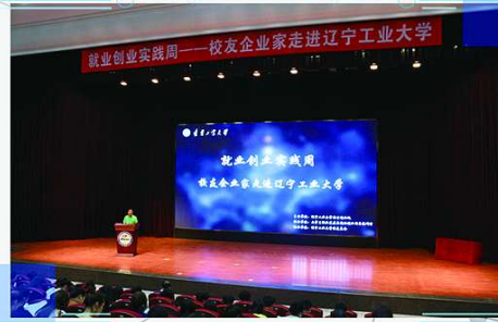
就业创业实践周——校友企业家走进辽宁工业大学