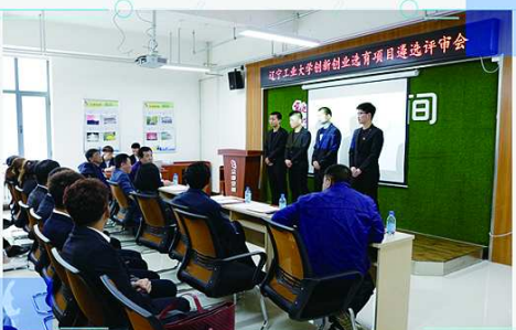
辽宁工业大学创新创业选育项目遴选评审会