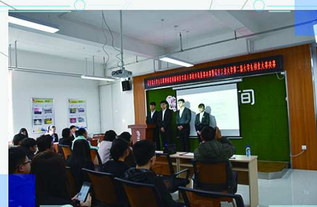
辽宁工业大学第二届创业大赛