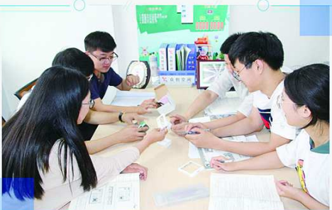
宝地砺器众创空间入驻团队工作间研讨