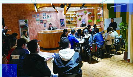
汇智·创享系列主题创业沙龙