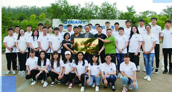
建立创业实践基地