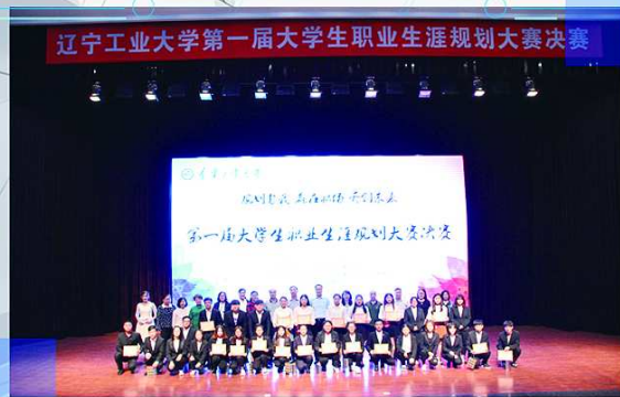
第一届大学生职业生涯规划大赛决赛