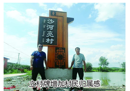
立村牌增加村民归属感

为了壮大增加村集体经济，增加村民收入，我分别请来了辉山乳业区域经理、现代化养殖的“牧原股份有限公司”、甜菜种植大户、林下养鸡项目经理来村考察投资环境，请果树种植专家来村进行现场指导。并分别考察了“青李子”“早金酥梨”“酒高粱”等种植，养牛、养驴、养猪、养鸡等养殖项目；考察了滴灌种植等新技术。在村里今年我重点推了花生种植和酒高粱种植，现在花生已经喜获丰收，酒高粱也已经帮助种植户联系好了销路。