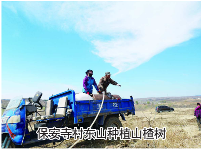
保安寺村泰山种植山植树

10月16日，我校在图书馆报告厅举办“不忘初心、牢记使命”专题培训暨精准扶贫先进事迹报告会。4名驻村书记代表先后做汇报，他们首先感谢学校党委对驻村扶贫工作的大力支持，并从自身工作出发，以不同的角度，用朴实生动的语言讲述了奋战在脱贫攻坚第一线的感人事迹。他们时刻牢记一名共产党员的初心使命和责任担当，因地制宜、精准施策，求真务实抓党建、东奔西走拉赞助，下村入户了解情况、解决民生实际问题，舍小家顾大家，始终坚持在党言党，为党分忧，为党尽责，他们雷厉风行的务实作风、义无反顾的奉献精神为全面打赢脱贫攻坚战贡献了自己的智慧和力量。下面，让我们走进他们，倾听他们的故事。