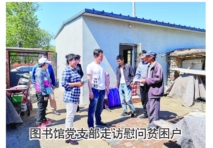
图书馆党支部走访慰问贫困户

最后，感谢学校给我驻村工作这个机会，让我了解并爱上了农民、农村和农业。从未有过和土地和自然如此地亲近，更知晓了春播夏作的艰辛，也感受到秋收冬藏的喜悦！