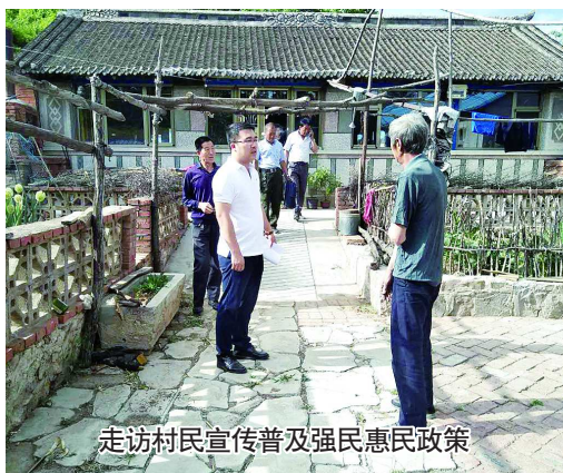
走访村民宣传普及惠民政策

为深入贯彻省委关于开展大规模选派干部到乡村工作部署要求，我于2018年3月被学校选派到葫芦岛市建昌县素珠营子乡石灰窑子村任驻村第一书记。