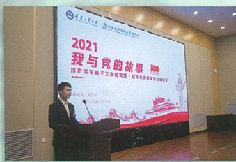
心理咨询技术引入活动，开展“党·校·家·寝”我的生命故事系列活动

2021年，心理健康教育活动实行“四个一体化”：心理中心联动相关职能部门大思政一体化、顶层设计-过程指导-效果监管推进一体化、训会结合与队伍培养一体化、心理咨询技术精进与本土转化一体化。拓宽教育覆盖面，推进校园心理活动品牌化、精品化，创新可复制、可推广的心理健康教育活动模式。