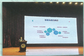
张卫平教授为研究生讲授“开学第一课心理课”