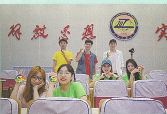
“5.25”心理健康节活动覆盖2.4万学生