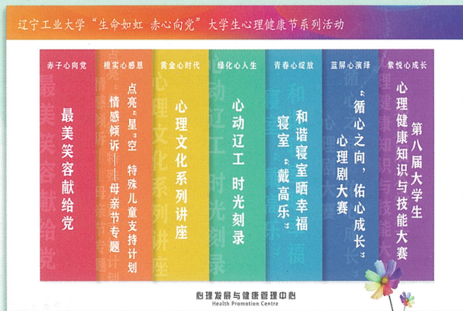
“生命如虹，赤心向党”精品活动