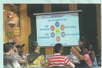
面向教职工开展身、心、体三维健康检测服务，提供教职工个体与家庭心理服务