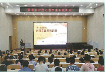
全年开展35场心理讲座，营造浓厚校园心理文化氛围